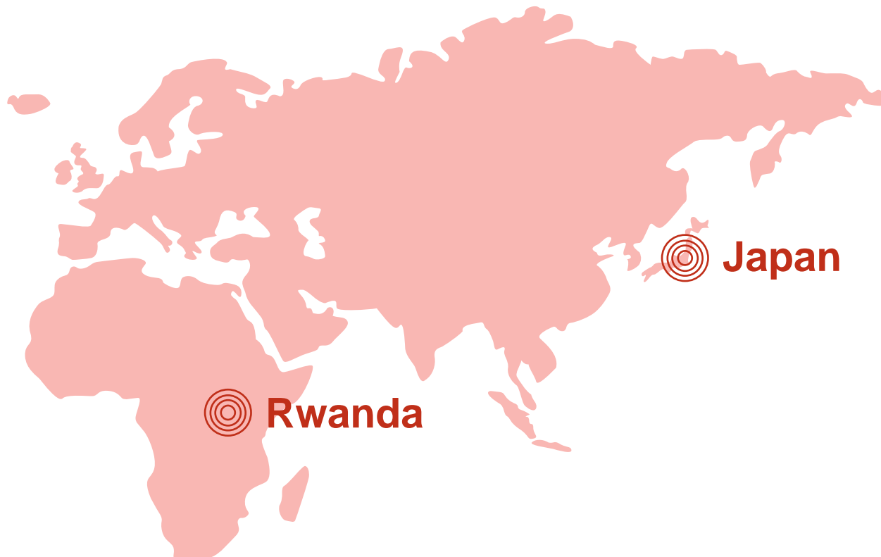
TABLE FOR TWO は開発途上国の飢餓と先進国の肥満や生活習慣病の解消に同時に取り組む、日本発の社会貢献運動です。

時計の文字盤をイメージしたワンプレートランチ「CITIZENおにぎりランチ」を提供し、10月16日の世界食料デーに合わせて開催される「おにぎりアクション」への参加を社員へ呼びかけました。