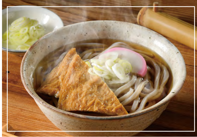
新商品「讃岐もち麦ダイシモチうどん」

新商品の「讃岐もち麦ダイシモチうどん」は食物繊維が豊富でヘルシー。ダイシモチ品種として全国初の機能性表示食品の承認をうけた讃岐うどんです。