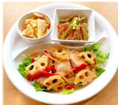
～鶏肉の黒酢南蛮ベジプレート～ 春雨と野菜の黒胡椒炒め・キャベツとコーンサラダ