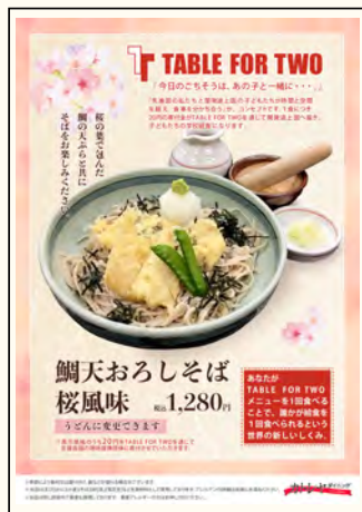
TFTチャリティヘルシーメニュー例