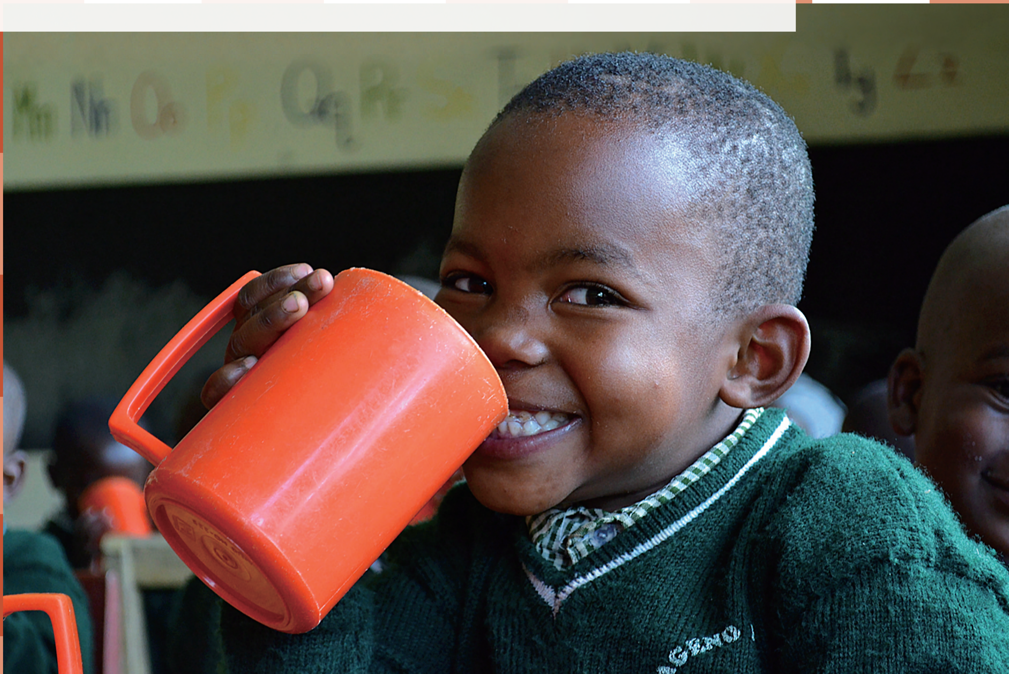
TABLE FOR TWO (TFT) の仕組み。

TABLE FOR TWOは、開発途上国の飢餓と先進国の肥満や生活習慣病という、相反する課題に同時に取り組む日本発の社会貢献運動です。TABLE FOR TWOを直訳すると「二人の食卓」。先進国の私たちと開発途上国の子どもたちが、時間と空間を越え食事を分かち合うというコンセプトで課題解決に取り組んでいます。