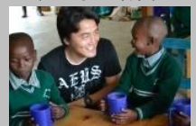
TABLE FOR TWOがグローバルに拡大していく中で、私たちの革新的な活動やプログラム導入企業との取り組み、そして東アフリカに与えているインパクトが注目されるようになりました。TFTは日本でファンドレイジング大賞を受賞しました。10月にあるファンドレイジング国際アワードでも候補として挙げられています。これから数ヶ月間に渡って他国でもTFTの認知度が上がることが予想されます。

サポーターの皆さんのご支援なくしてはTFTはここまで成長できませんでした。まだ先は長いですが皆様一人一人のご支援に、心から感謝申し上げます。