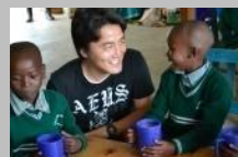
TABLE FOR TWO

学生の皆さんは、彼らが持つ環境を最大限に生かし、世界の食の不均衡の改善のためにクリエイティブなアイデアを出し、そして実際に行動を起こしています。彼ら若いサポーターこそが未来であり、彼らがTFTのメッセージを広めてくれる事を大変嬉しく思います。