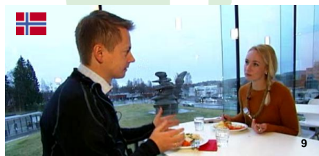
TABLE FOR TWO代表 小暮よりメッセージ

今月はアメリカの大学のキャンパスでTFTの急速な広がりが見られました。4月上旬の2週間に4つの大学でTFTプログラムが始まりました。日本と香港の学生も引き続き積極的な取り組みを見せてくれています。