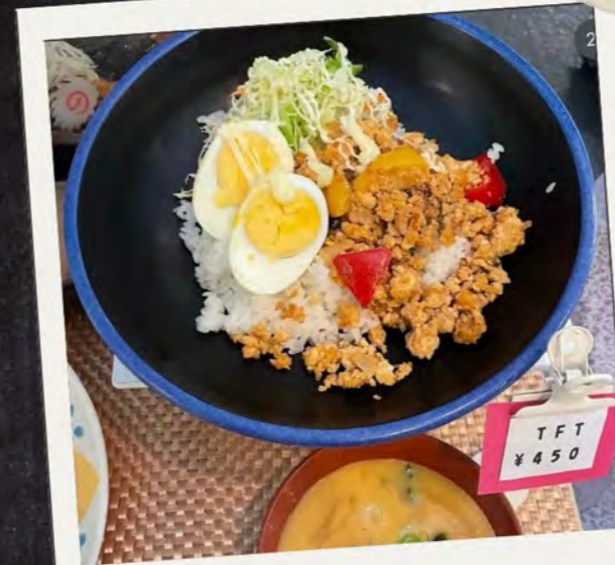
和風ガパオライス