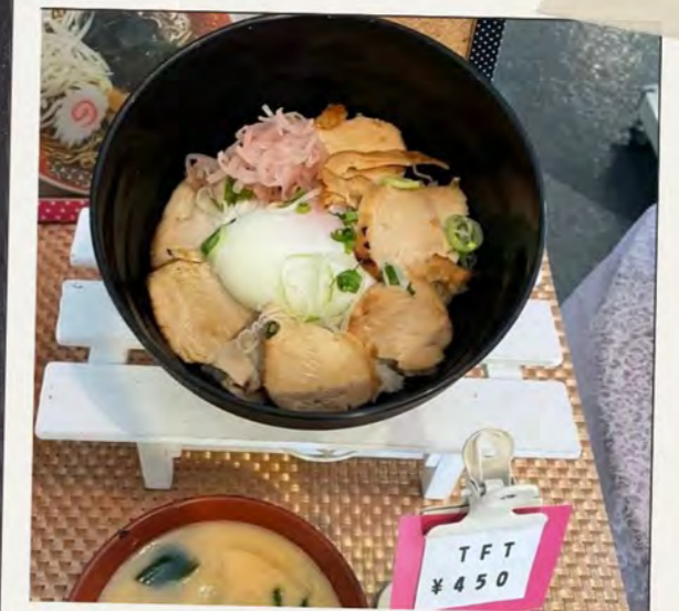
鶏むね肉の チャーシュー丼