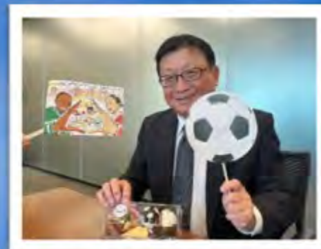
藤本社長（現・会長）もおにぎりを試食