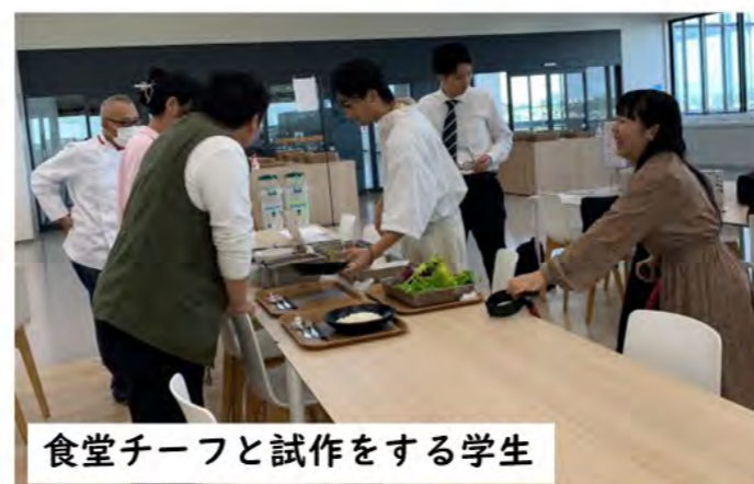
食堂チーフと試作をする学生

TFTメニューを提供する帝京大学永井ゼミのモットーは「 学生がやる! 」。学食事業者「銀座スエヒロ」の協力の下、自分たちでメニュー案や材料、盛り付けまで考えます!