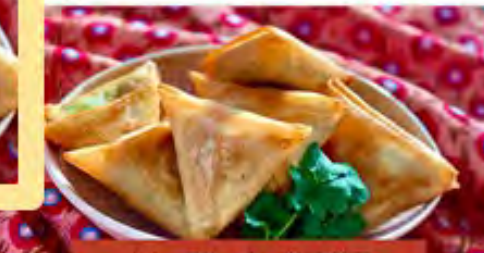
カレー風味のタンザニア餃子 サモサ (sambusa)

インドや南アジアから伝わった「サモサ」は、タンザニアでも 最も人気のある人気のストリートフード。お好みで ミンチやチーターを加えればお肉のおやつも完成。