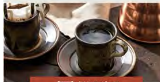
【TFT】キリマンジャロ ドリップバックコーヒー

タンザニアのAAグレード豆を使用した、本格ドリップバック コーヒーです。まるやんやんコクの中身に包みこみを実現し さらに上がっています。こちらの商品は1袋につき、TFTの寄 附が出来ます。