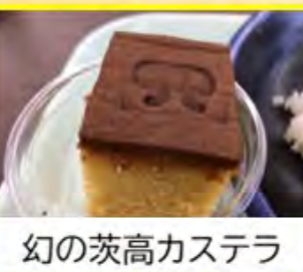
幻の茨高カステラ