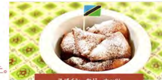
スパイシーなドーナッツ マンダジ (Maandazi)

インドや南アジアから伝わった「サモサ」は、タンザニアでも 最も人気のある人気のストリートフード。お好みで ミンチやチーターを加えればお肉のおやつも完成。