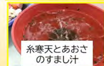
糸寒天とあおさ のすまし汁