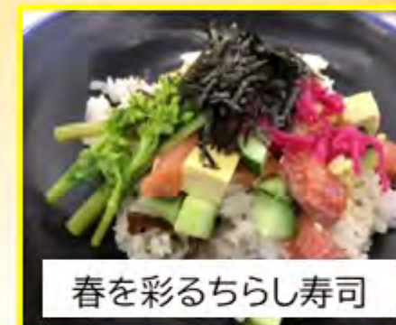
春を彩るちらし寿司