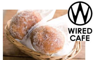
『オリジナルマラサダ』