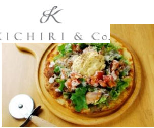
『具沢山サラダピザ』

“KICK OFF AFRICA!” イベント (JICA 地球ひろば) にて、TFT紹介の展示を行いました。 来場者の方に電通オリジナルのTFT矢印を持って写真を撮影いただき、キャンペーン特設サイトからアフリカへールを送りました。