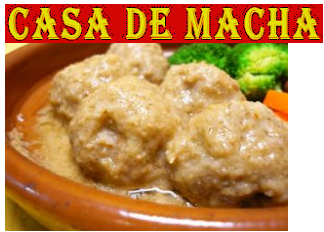
『スペインの肉団子 アーモンドソース煮込み』