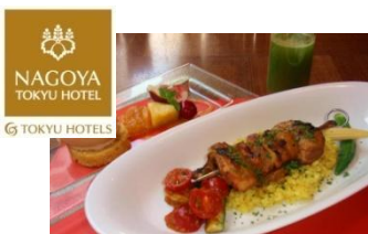
『ケープマレー ソサティ』