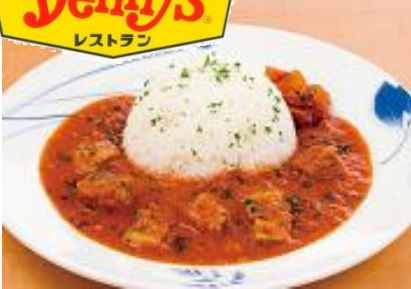
『南アフリカ風レッドトマトビーフカレー』