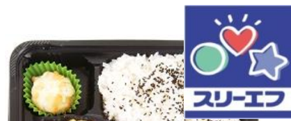
『豚肉とキャベツの味噌炒め弁当』