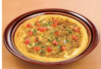
『ドライカレーと卵のオープン焼き』