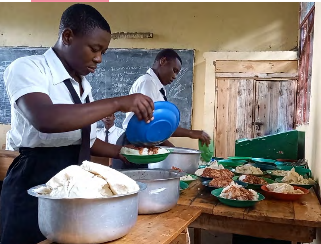
給食を配膳するバンダ村の高校生