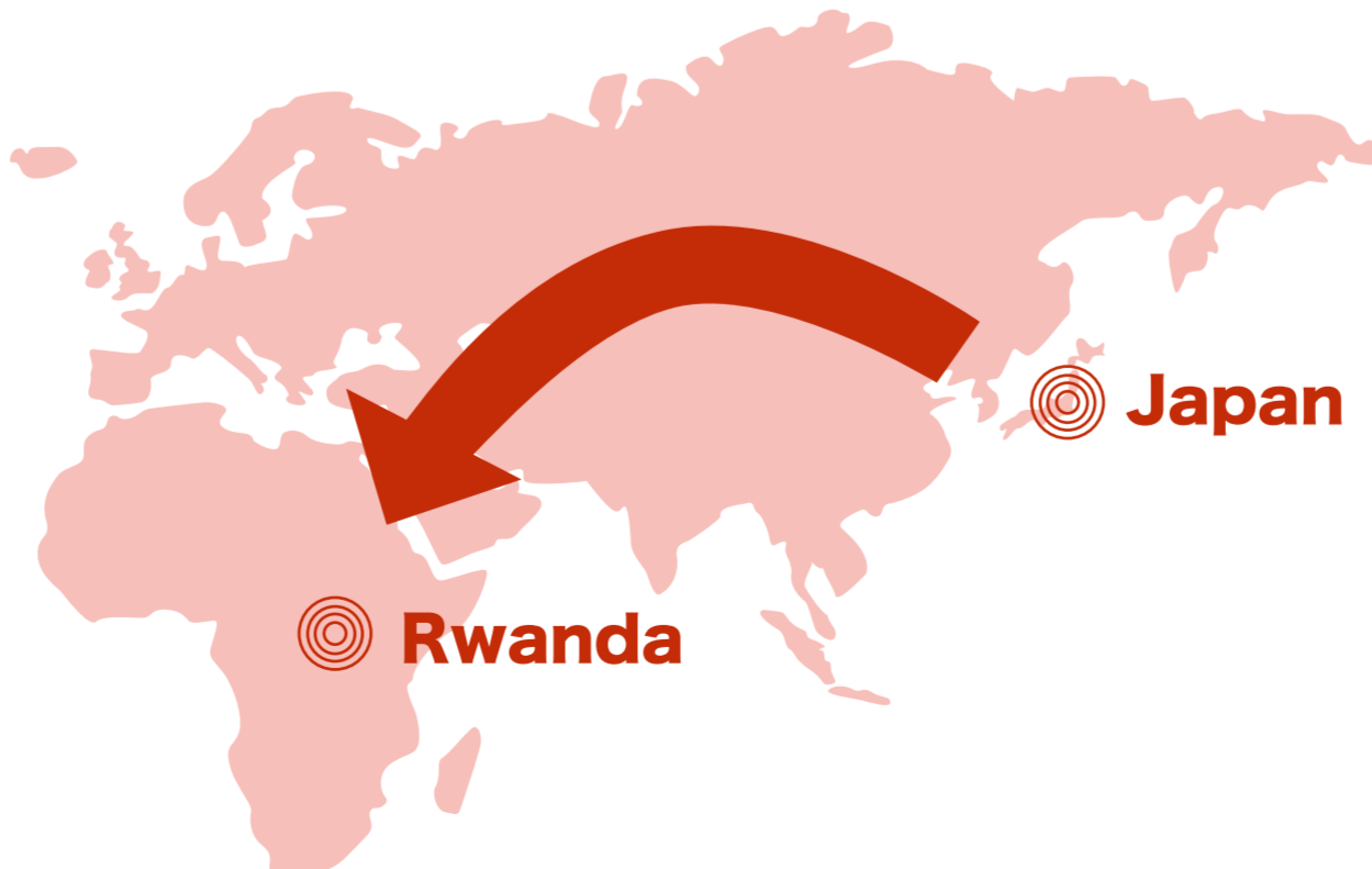
TABLE FOR TWOは開発途上国の飢餓と先進国の肥満や生活習慣病の解消に同時に取り組む、日本発の社会貢献運動です。

「給食のおかげで子どもがみるみる健康になった」と喜ぶ母親・ムカベラさん。「下の子はまだ小さいですが、3歳になったらこの幼稚園に通わせたい」と語ります。給食が始まってから、園児数も出席率も、日々上がり続けています。