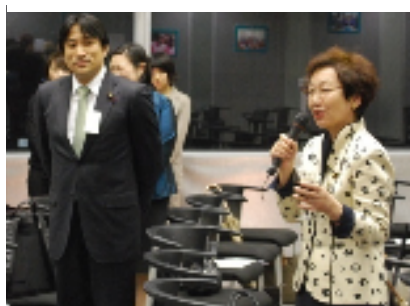
(川口順子元外務大臣と川田龍平参議院議員)